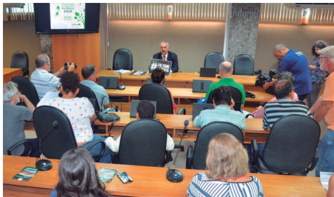
Colegiado defendeu punição para os responsáveis pela tragédia em Brumadinho

vice-presidência da Comissão de Meio Ambiente, Seca e Recursos Hídricos da Assembleia Legislativa.