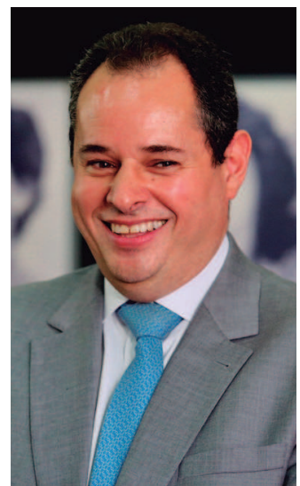
O presidente da ALBA ressaltou o caráter revolucionário do bloco