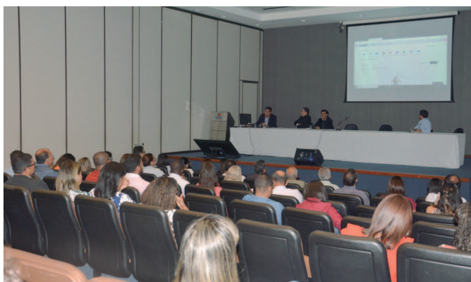
Analistas da Casa explicaram o processo para uma plateia extremamente atenta